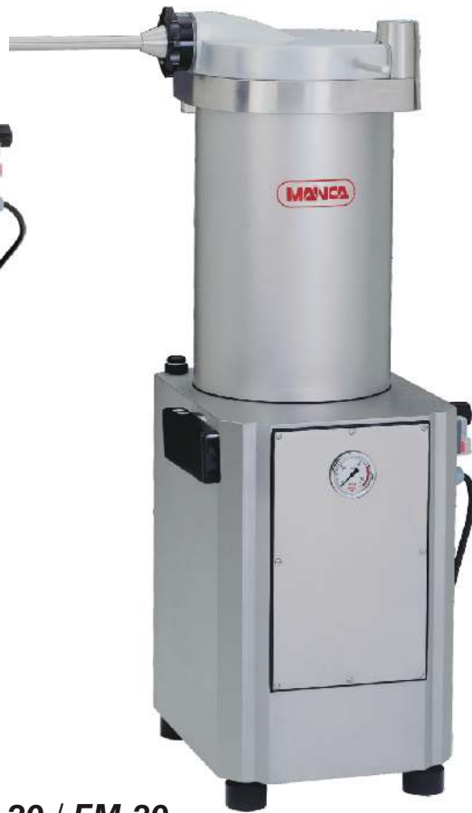
EM-20 / EM-30